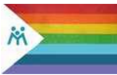
Bandera del Mutualismo

Es decir que, por el principio 5, los excedentes deben capitalizarse socialmente, pero no pueden distribuirse entre socios. En este sentido la figura de Asociación de tipo Mutual, es similar a la de Asociación Civil.